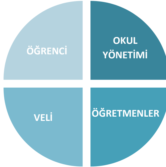
Şekil 1: Okul Temel Paydaşları

Stratejik Planlama sürecinde katılımcılığa önem veren kurumumuz tüm paydaşların görüş, talep, öneri ve desteklerinin stratejik planlama sürecine dâhil edilmesini hedeflemiştir. Bu kapsamda Malazgirt İlkokulu, faaliyetleriyle ilgili sunulan hizmetlere ilişkin memnuniyetlerin saptanması, kuruma ilişkin beklentiler, kuruma ilişkin durum tespiti, kurumsal iş birliği ve eşgüdüm, GZFT, önerilerin tespiti vb. konular hakkında Malazgirt İlkokulu Stratejik Planlama Ekibi ile toplantılar düzenlenmiş ve kurumumuzun temel paydaşları olan öğrenci, veli ve öğretmenlerin görüş ve önerilerini almak üzere görüşme ve anket yöntemi uygulanmıştır.